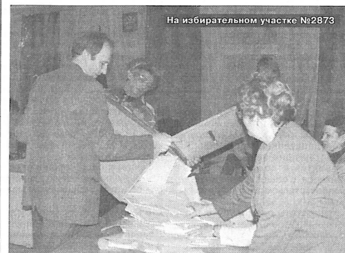
На избирательном участке №2873