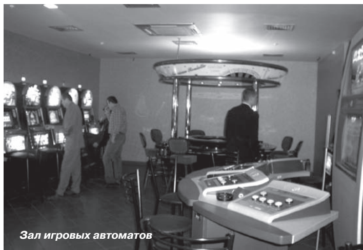
Зал игровых автоматов